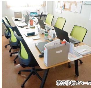
就労移行スペース